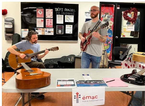
Animation musicale dans les écoles secondaires

– Le projet favorisant le bien-être des jeunes de 12 à 18 ans s'est poursuivi en partenariat avec les écoles secondaires de la région. Pour cette deuxième année de mise en œuvre, il a permis de consolider et d'élargir les liens avec le milieu scolaire, tout en confirmant la pertinence de la musique comme outil de motivation et de mieux-être. Grâce aux recommandations de six intervenants psychosociaux provenant de l'École secondaire de Rivière-du-Loup, du Collège Notre-Dame et de l'École des Vieux-Moulins de Saint-Hubert-de-Rivière-du-Loup, huit élèves ont pu bénéficier de cours privés hebdomadaires dans cinq disciplines instrumentales différentes.