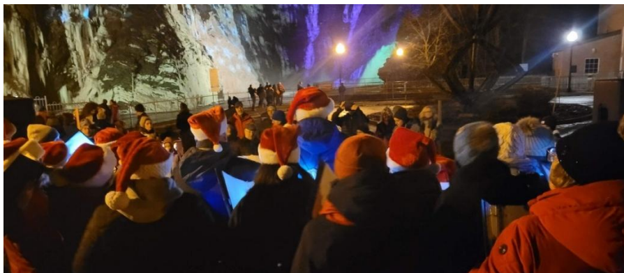
Chœur du Fleuve à l'illumination des Chutes