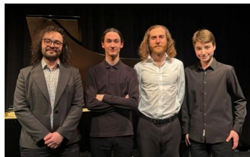
Concerts de la relève

À l'école, 15 concerts ont été présentés, rassemblant près de 1100 spectateurs au total. Le grand concert Kourage symphonique, tenu au Centre culturel Berger en collaboration avec l'Orchestre de chambre du Littoral, a quant à lui attiré 375 spectateurs, confirmant la portée régionale des activités de l'ÉMAC. Enfin, la Série Concerts de la relève – Club des Mélomanes, réalisée en partenariat avec le Conservatoire de musique de Rimouski, a permis à de jeunes musiciens de se produire lors de trois concerts, devant près de 90 mélomanes.