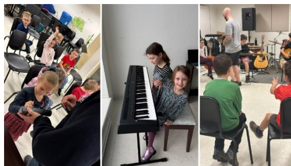
Musée des Instruments