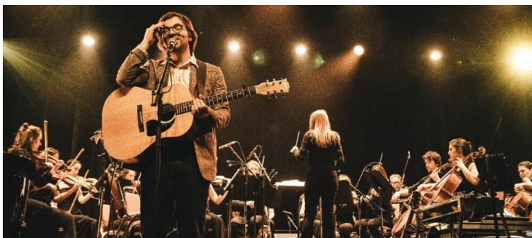
Grand Concert de l'ÉMAC « Kourage Symphonique »